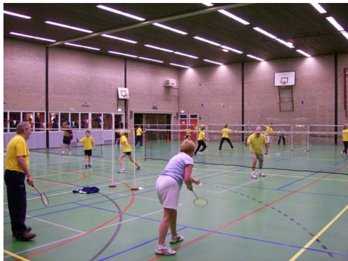
Foto van het jubileumtoernooi